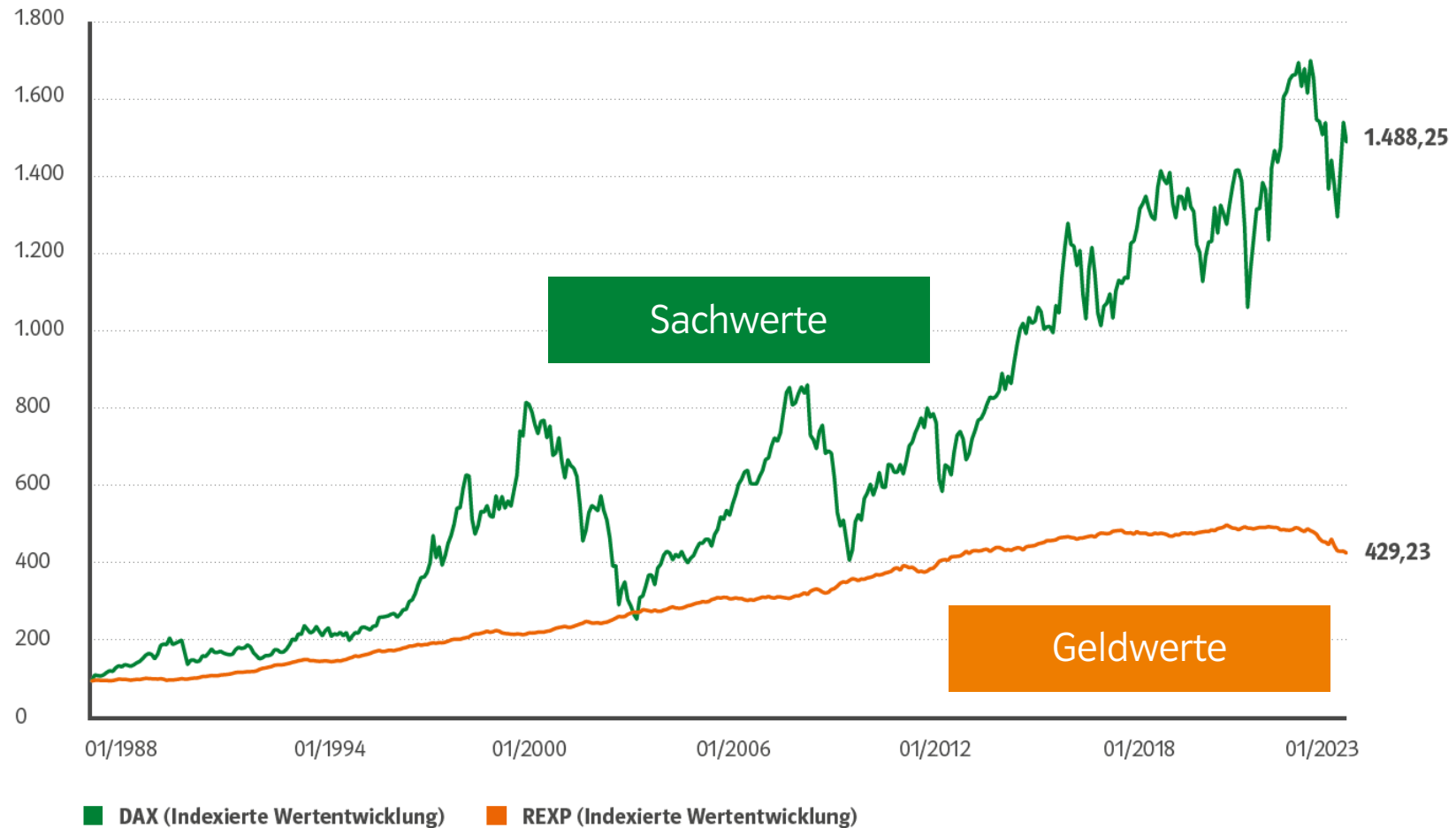
INDEXIERTE WERTENTWICKLUNG SEIT 1988